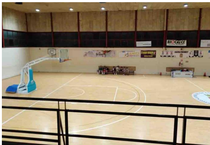
Figura 1: PALESTRA POLIVALENTE - PALABASKET di Ascoli Piceno: svolti campionati Under, Senior Maschile fino alla C Regionale e Femminile fino alla B, tornei federali e attività FIP – CONI