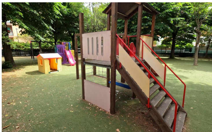
Figura 5: Esterni strutture scolastiche ove le tre entità svolgono le proprie attività