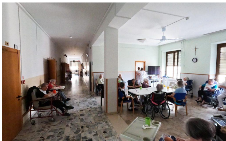
Figura 8: Alcuni degli anziani ospiti della struttura del Pensionato dell'Istituto