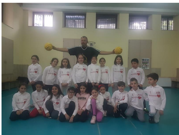
Figura 7: I Bambini del Minibasket dell'Istituto Prez. Sanguè AP con il nostro Istruttore M. di M.