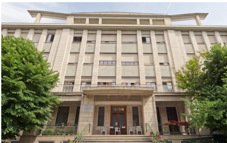
Figura 4: Esterno dell'ISTITUTO PREZIOSISSIMO SANGUE DI ASCOLI PICENO, dove le tre entità svolgono attività formativa, sportiva, di inclusione sociale. Nella struttura sono presenti 25 Bambini della Scuola Materna; 75 Bambini della Scuola Elementare; 50 Over 65/donne in maggioranza non autosufficienti; 12 Soggetti Disabili