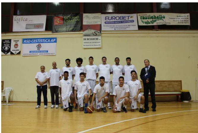
Figura 2: Squadra Senior Maschile