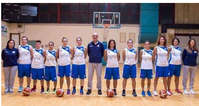
Figura 3: Squadra Senior Femminile