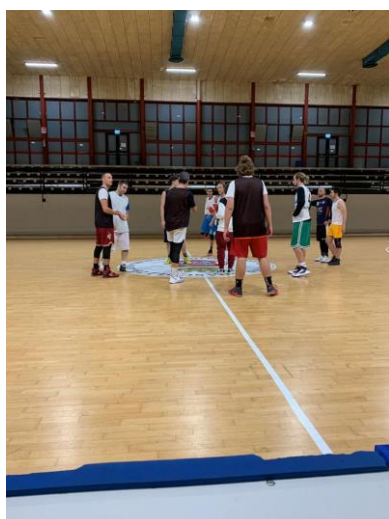
Figura 7: La squadra di Promozione Maschile durante un allenamento