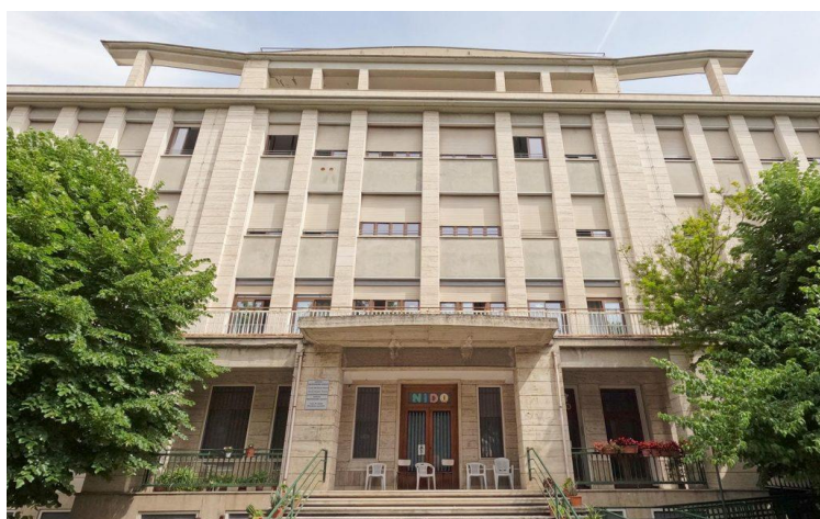
Figura 4: Esterno dell'ISTITUTO PREZIOSISSIMO SANGUE DI ASCOLI PICENO, dove le tre entità svolgono attività formativa, sportiva, di inclusione sociale. Nella struttura sono presenti 25 Bambini della Scuola Materna; 75 Bambini della Scuola Elementare; 50 Over 65/donne in maggioranza non autosufficienti; 12 Soggetti Disabili