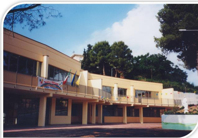
Figura 7: Esterno dell'ISTITUTO MARIA IMMACOLATA di San Benedetto Del Tronto