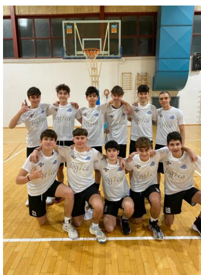
Figura 8: La Squadra Under 17 Maschile, MAIN SPONSOR "LOGICA SRL"